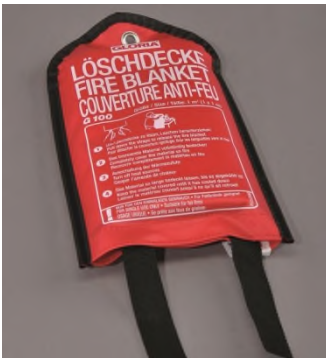
GLORIA Löschdecke G100