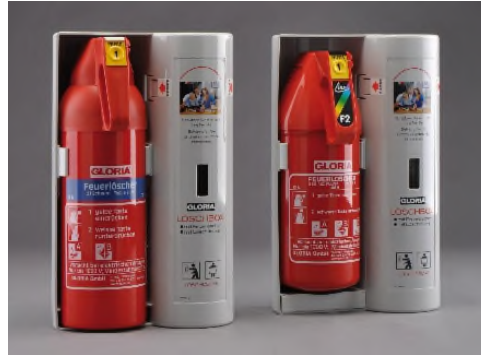
Löschdecken in der GLORIA Lösbox