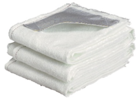
GLORIA Löschdecke LD1