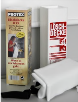
PROTEX Löschdecke K 75

Sicherheit hat bei GLORIA höchste Priorität. Aus Gründen des vorbeugenden Verbraucherschutzes rufen wir daher die nachstehend abgebildeten Löschdecken der Marken PROTEX und GLORIA zurück, die seit 2005 über verschiedene Handelsunternehmen in den Verkehr gebracht wurden: