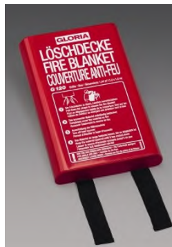
G120 in der Hardbox