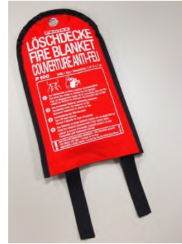
PROTEX Löschdecke P100